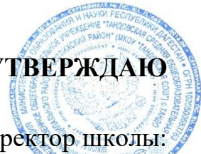
График приема пищи учащихся 1-4 классов