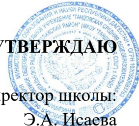
График посещения родителей пищеблока с целью осуществления контроля качества питания обучающихся